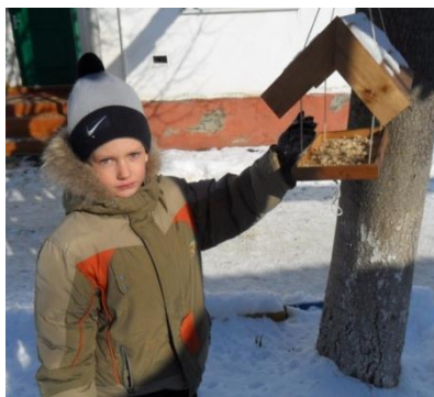
Зимняя помощь птицам