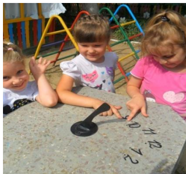
Определение времени с помощью солнечных часов

С помощью флюгера и ветряного рукава проводятся наблюдения за ветром. На нижней части флюгера находятся буквы (С-Ю-З-В), окрашенные в яркие цвета, для лучшей ориентировки детям. Ветряной рукав позволяет определить силу ветра, изготовлен из шелковой ткани белого и красного цветов родителями воспитанников. Детям очень нравится определять и заносить в календарь наблюдений с помощью условных знаков температуру и влажность воздуха, наличие и количество осадков. В конце месяца, сезона анализируем результаты, делаем выводы: какая погода была в течение месяца, сезона; как она менялась, сколько дней было ясных, пасмурных, дождливых или снежных, ветреных, морозных.